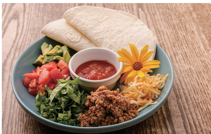
Tacos ヤマトタコス 1,600 yen 大和牛、ヤマトポーク、帯解レタスと奈良を代表する食材を使用しています。