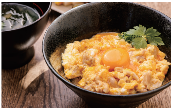
Chicken & egg bowl OPEN~14:00 限定の提供 ヤマトの親子丼 1,600 yen シェフ渾身の逸品。奈良の高原で育った"びよたま"の卵と奈良県産"かしわ"を使用しています。

ランチset OPEN~14:00 ソフトドリンクメニューよりお好きなものをお選びください。200yen引でご提供いたします。