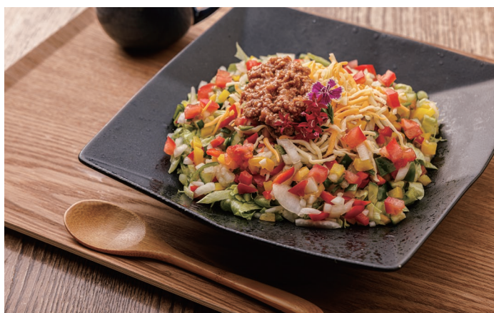
Taco rice ヤマトタコライス 1,600 yen 大和牛、ヤマトポーク、帯解レタスと奈良を代表する食材を使用しオリジナルサルサを共に混ぜながらご賞味ください。