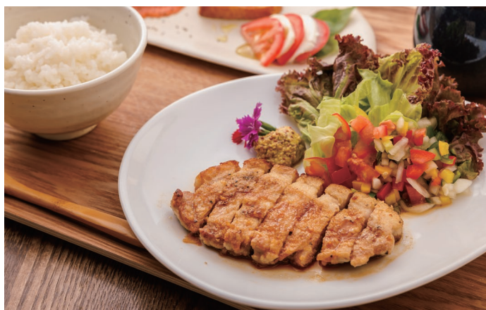
SKY lunch plate OPEN~14:00 限定の提供 SKY ランチプレート 1,600 yen その日厳選のメインをご提供します。 ごはん・スープ・サラダ ※OPEN~14:00限定